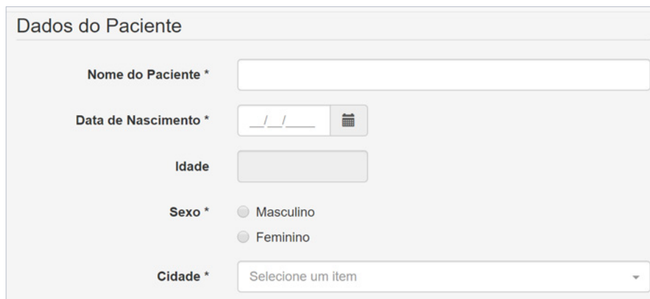
Figura 2. Dados do paciente